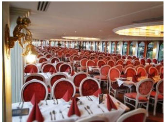
Weisse Flotte Potsdam, Lange Brücke 6, 14467 Potsdam