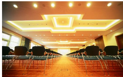
Seminaris SeeHotel Potsdam