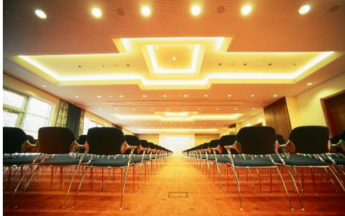
Seminaris SeeHotel Potsdam