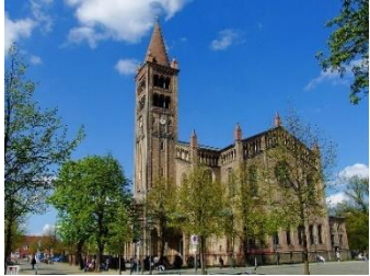
Peter-und-Paul-Kirche, Am Bassin 2, 14467 Potsdam