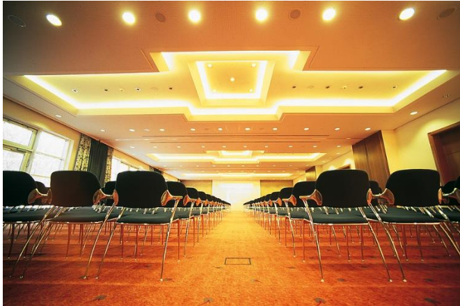
Seminaris SeeHotel Potsdam